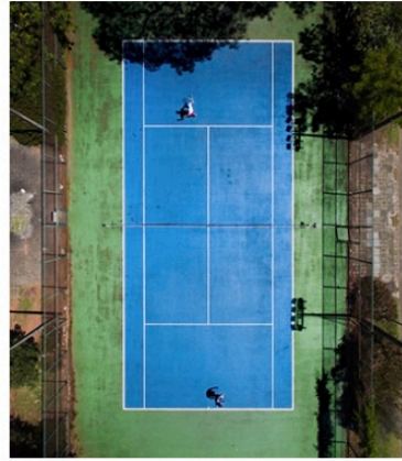
Pádel is the new cool