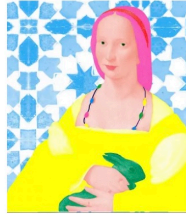
" Je suis étudiant-e au Louvre"