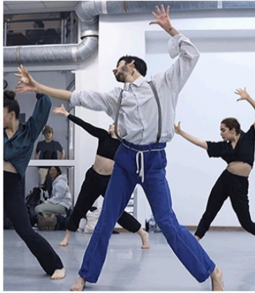
L'école de danse comme à New-York

Ils sont vintage, réveillent des trips d'ado, des désirs inassouvis, des rêves d'autre vie : les cours qu'on vous a choisis pour enfin penser à vous, dans le tourbillon de cette rentrée. 2022.